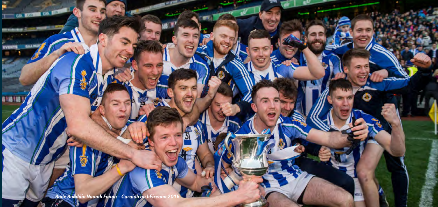
Baile Buadáin Naomh Éanna - Curaidh na hÉireann 2016

Suite in iardheisceart Chontae Bhaile Átha Cliath, tá Baile Buadáin Naomh Éanna ar cheann de na clubanna is mó ball sa tír agus é ag freastal ar go maith os cionn 3,000 ball idir óg agus aosta agus idir fhir agus mhná.