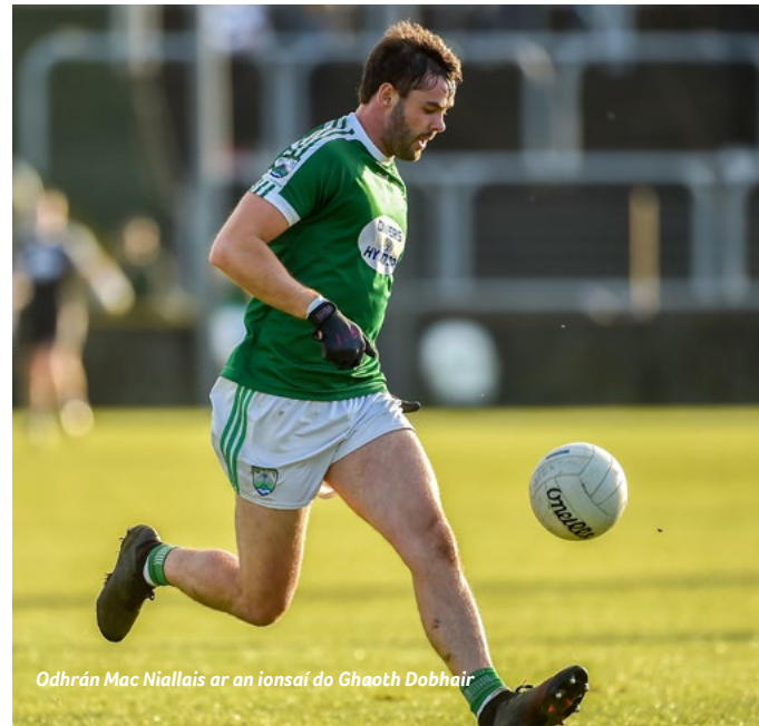
Odhrán Mac Niallais ar an ionsaí do Ghaoth Dobhair

B. Cill Chomáin (Maigh Eo) v Laochra Loch Lao (Aontroim)