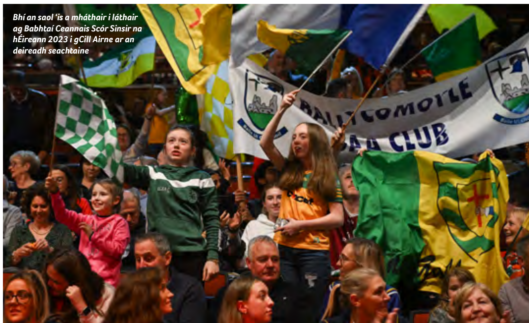
Bhí an saol 'is a mháthair i láthair ag Babhtaí Ceannais Scór Sinsir na hÉireann 2023 i gCill Airne ar an deireadh seachtaine