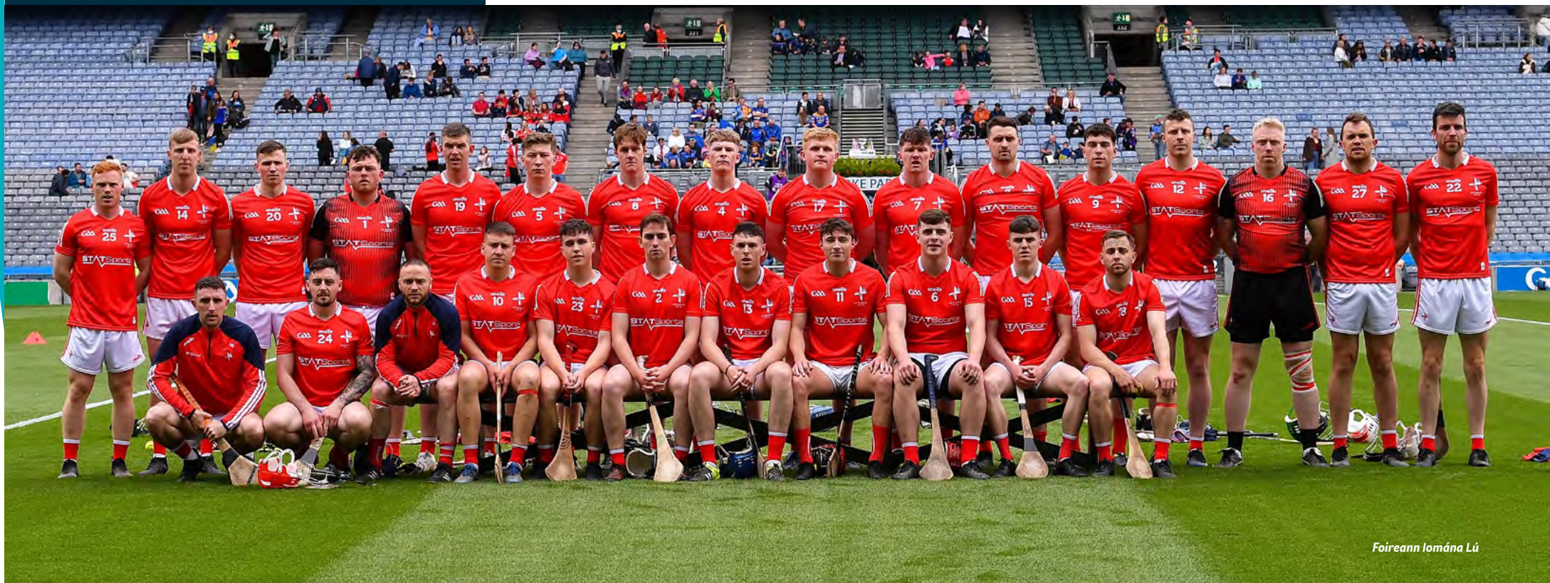
Foireann Iomána Lú