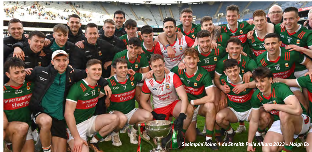
Seaimpíní Roinn 1 de Shraith Peile Allianz 2023 - Maigh Eo

Cill Aodáin an baile a bhfásann gach ní ann, Tá sméara 's subh craobh ann is meas de gach sórt, Is dá mbéinnse i mo sheasamh i gceartlár mo dhaoine D'imeodh an aois díom is bheinn arís óg.