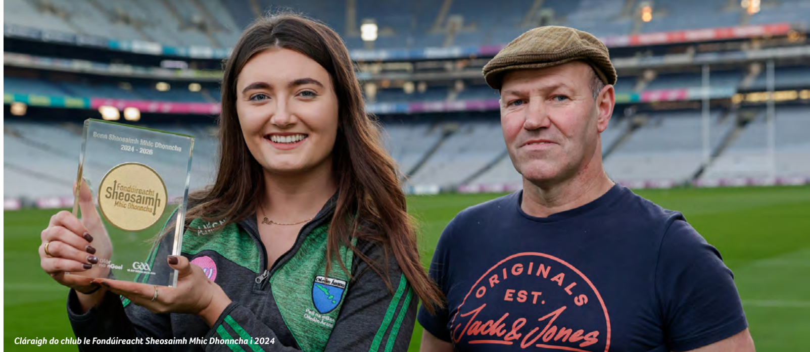
Cláraigh do chlub le Fondúireacht Sheosaimh Mhíche Dhooncha i 2024

Tá féile Sheachtain na Gaeilge thart faoin tráth seo ach ní hionann sin is a rá nach féidir linn ár gcuid Gaeilge a chleachtadh arís go dtí mí Márta na bliana seo chugainn! Ábhar bróid don chumann an méid ball, clubanna, conteatha agus cúigí fud fad na cruinne a ghlac páirt san fhéile i mbliana, ar bhealach amháin nó ar bhealach eile, agus ghlac go leor páirt sa chomhrá ar líne ag #GAAGaeilge, freisin. Ná cuirimis deireadh leis an gcomhrá anois! Coinnimis orainn ag cur chun cinn na Gaeilge inár gcuid clubanna agus inár gcuid pobal. Bíodh an Ghaeilge ag croílár ár gclubanna agus ár gCumann!